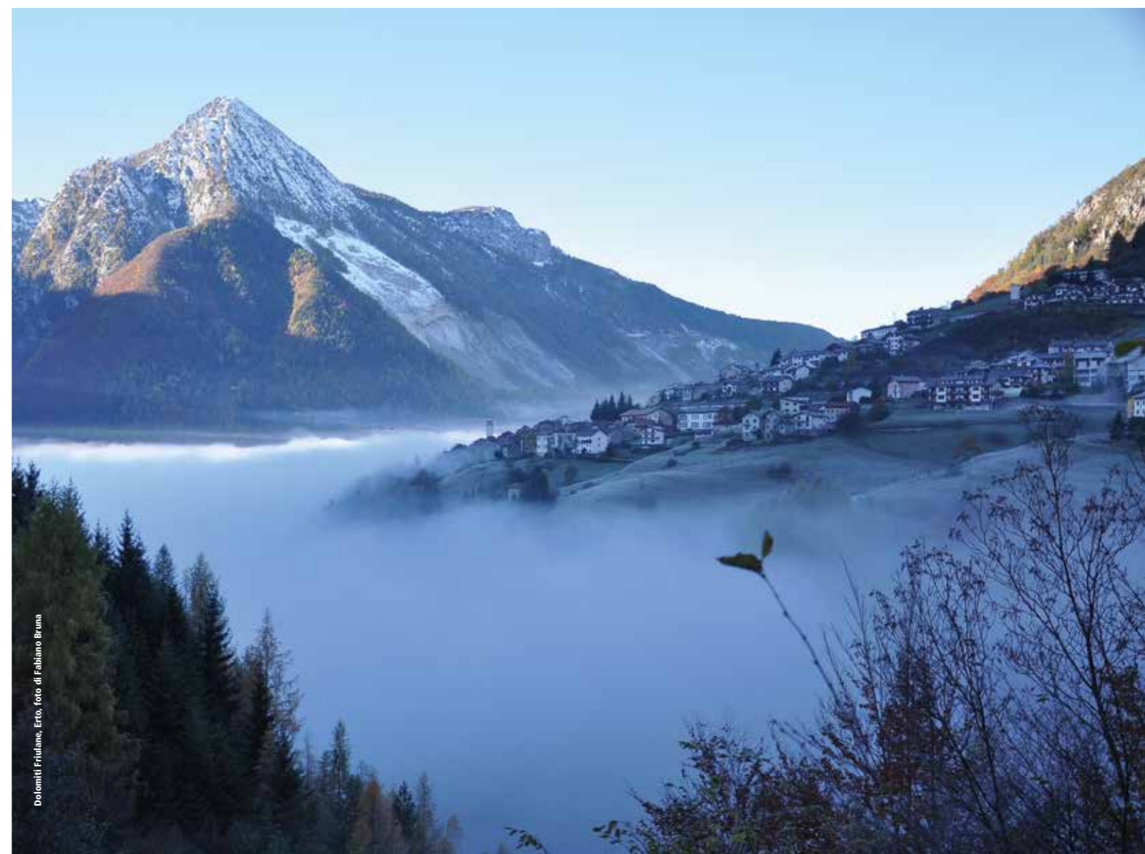
Dolomiti Friulane.

14/15/16 OTTOBRE 2021 - FORNI DI SOPRA, TOLMEZZO (UD)